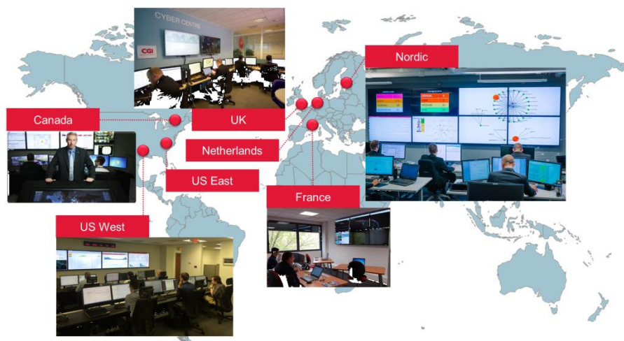
Abb. CGI's Security Operation Center

In sieben globalen Security Operation Centern (SOC) überwacht CGI die Systeme ihrer Kunden aus dem privatwirtschaftlichen bzw. öffentlichen Bereich. Neben diesen SOC, die die Überwachungsdienstleistungen als Service erbringen, gibt es noch weitere von CGI betriebene SOC, die exklusiv für einen Kunden bzw. eine Kundengruppe eingerichtet sind.